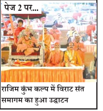
राजिम कुंभ कल्प में विराट संत समागम का हुआ उद्घाटन

www https://www.raigarhsandesh.com https://epaper.raigarhsandesh.com dainikraigarhsandesh@gmail.com 09479641256